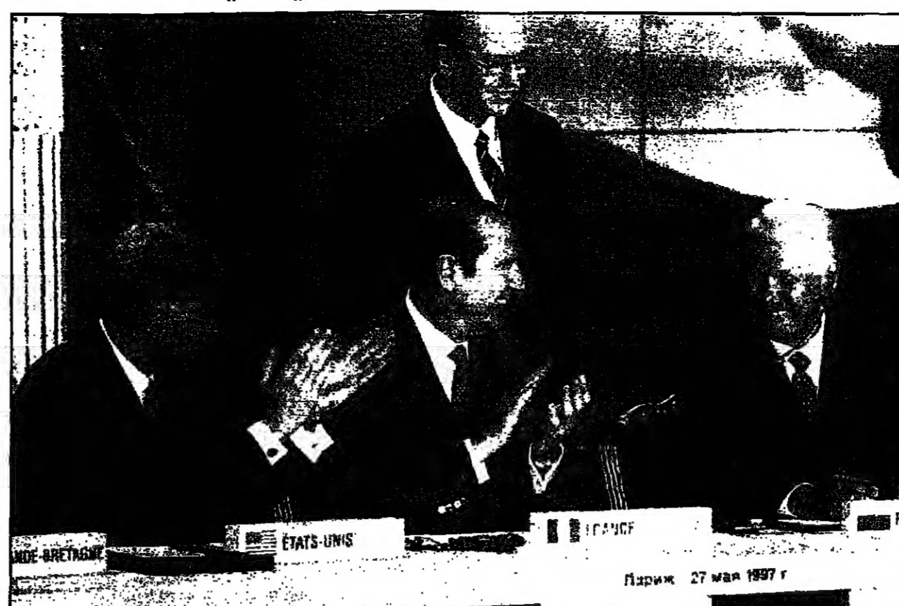
الرئيس الأمريكي بيل كلينتون (يسار) والرئيس الفرنسي جاك شيراك (وسط) يوقعان لتفكيك الرؤوس النووية (يسار) بين موسكو وحلف الأطلسي (يمين)

باريس - الرئيس الروسي ييلتسين أكد في كلمته التي ألقاها في باريس، مساء الاثنين، أن التفكيك التدريجي للرؤوس النووية المصوبة نحو دول حلف شمال الأطلسي، خطوة حاسمة في عملية تعزيز الأمن والاستقرار في أوروبا الشرقية. وقد وقع على الوثيقة الاستراتيجية التي تم توقيعها بين الرئيسين ييلتسين و克林تون والرئيس الفرنسي جاك شيراك، في باريس، اتفاق تاريخي يفتح على آفاق تعاون أمني بين أوروبا بين العمودين السابقين في الحرب الباردة. وتعد العلاقات الجديدة بين الجانبين الرئيسيين بوليس و克林تون والأمين العام لحلف شمال أوروبا (ناتو) (الاسباني)، وستؤدي الوثيقة العلاقات الجديدة بين الحلف الأطلسي وروسيا وتفتح من نتائج توسيع الحلف الأطلسي أمام دول أوروبا الشرقية على موسكو. وذكر ييلتسين في كلمة له في باريس، مساء الاثنين، أن التفكيك التدريجي للرؤوس النووية المصوبة نحو دول حلف شمال الأطلسي، خطوة حاسمة في عملية تعزيز الأمن والاستقرار في أوروبا الشرقية. وقال ييلتسين إن التفكيك التدريجي للرؤوس النووية المصوبة نحو دول حلف شمال الأطلسي، خطوة حاسمة في عملية تعزيز الأمن والاستقرار في أوروبا الشرقية. وقال ييلتسين إن التفكيك التدريجي للرؤوس النووية المصوبة نحو دول حلف شمال الأطلسي، خطوة حاسمة في عملية تعزيز الأمن والاستقرار في أوروبا الشرقية. وقال ييلتسين إن التفكيك التدريجي للرؤوس النووية المصوبة نحو دول حلف شمال الأطلسي، خطوة حاسمة في عملية تعزيز الأمن والاستقرار في أوروبا الشرقية.